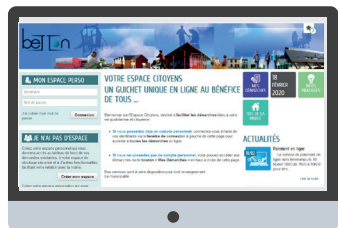
Mon Espace Citoyens

Les pré-inscriptions aux séjours se font en ligne sur votre espace citoyens du 27 avril au 17 mai 2026 .