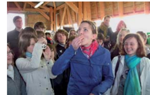
Dégustation d'huîtres à Cancale