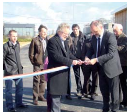
Inauguration de la cuisine centrale et du centre technique le 28 mars

La médiathèque a reçu le prix Eco-Faur de la région Bretagne dans la catégorie bâtiments et équipements publics pour sa haute qualité environnementale. Il distingue sa parfaite intégration dans l'environnement et sa construction exemplaire en matière de développement durable. La remise des prix a eu lieu le 18 mars dernier à Guipavas et une subvention de 84 480 € a été versée dans le cadre de l'appel à projets 2005.