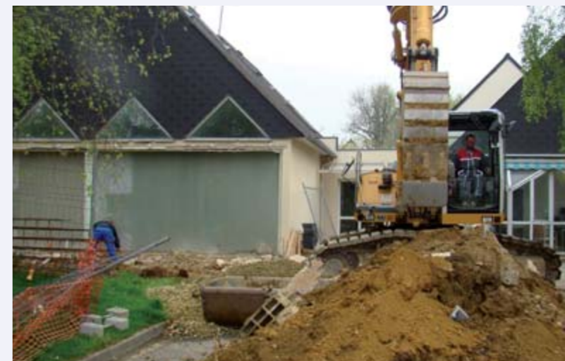
Les travaux ont débuté à la Résidence en février

Les agents bénéficieront également de meilleures conditions de travail avec la création d'une lingerie mieux organisée qui facilitera la prise en charge du linge des résidents. En lien avec