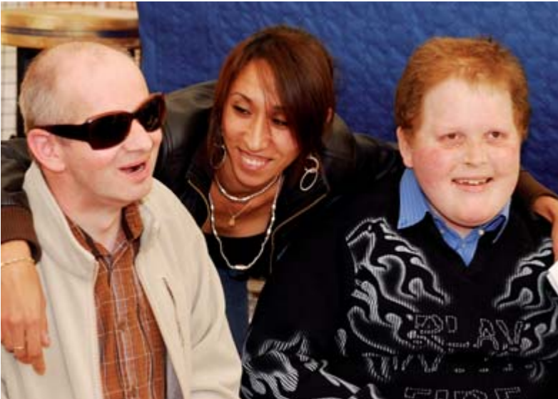
Rencontre entre Assia et les résidents

Assia El Hannouni est une athlète handisport qui a progressivement perdu la vue à partir de 1999. Son handicap ne lui coupe pas l'envie de continuer le sprint. Elle remporte ainsi titre sur titre à partir de 2003. Assia signe des performances hors norme aux Jeux Paralympiques d'été 2004 à Athènes. Elle remporte en effet pas moins de quatre médailles d'or en 100, 200, 400 et 800 mètres !