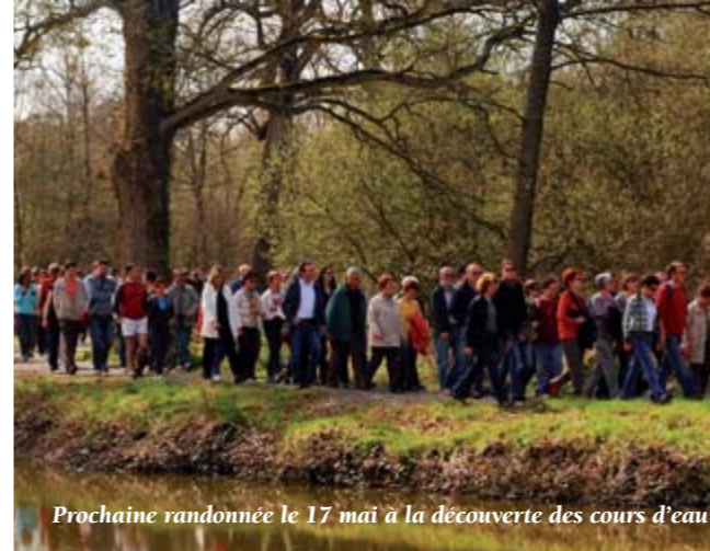
Prochaine randonnée le 17 mai à la découverte des cours d'eau

L'association PRIMEVERES, basée à Noyal-Châtillon sur Seiche, œuvre depuis 1975 au service des enfants de 1 à 6 ans présentant un handicap. L'association recherche des bénévoles pour accompagner un enfant, du domicile des parents à la halte-garderie (aller-retour), un après-midi par semaine et/ou pour participer, avec des professionnels de la petite enfance, à l'animation de la halte-garderie spécialisée (ouverte l'après-midi de 13h30 à 17h en période scolaire). Pour tout renseignement, s'adresser à PRIMEVERES au 02 99 50 72 64 ou consulter le site Internet : halte-garderie-primeveres.org