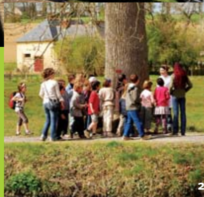
1 et 2) 200 personnes sont venues découvrir l'histoire du canal et le fonctionnement d'une écluse, le 5 avril