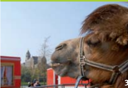
3) Le 21 avril, les chameaux s'étaient installés place de la Cale pour un spectacle de cirque 4) Démonstration de figures en skate le 18 avril