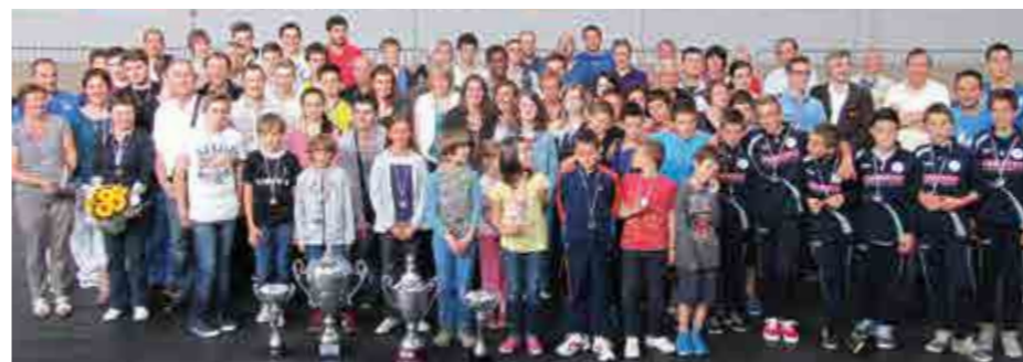
Le 28 juin, 120 sportifs bettonnais ont été récompensés pour leurs exploits sportifs ou leur investissement bénévole.

Informations auprès de la FEVILDEC : 02 23 48 26 23.