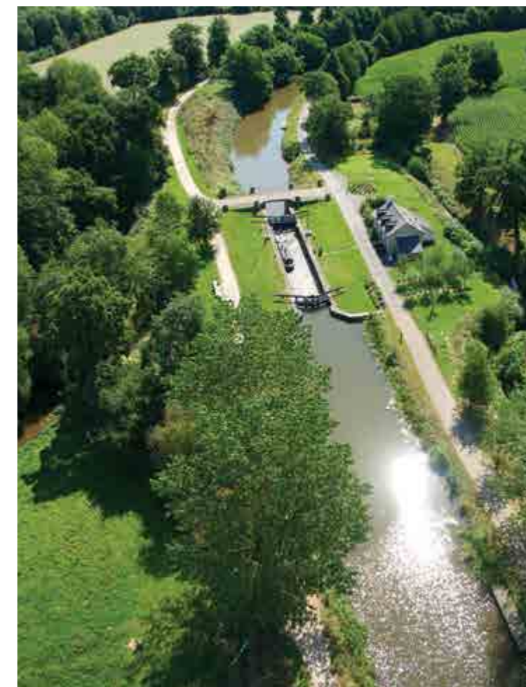
Vue aérienne de l'écluse des Brosses, une des trois écluses bettonnaises.

Conformément à l'article L. 52-1, alinéa 2 du Code électoral qui rappelle qu'« à compter du premier jour du sixième mois précédant le mois au cours duquel il doit être procédé à des élections générales, aucune campagne de promotion publicitaire des réalisations ou de la gestion d'une collectivité ne peut être organisée sur le territoire des collectivités intéressées par le scrutin », l'éditorial du magazine municipal est supprimé jusqu'aux élections municipales de mars 2014.