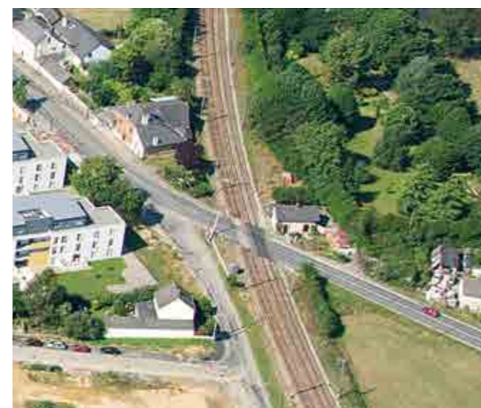
Le passage à niveau de Maison Blanche est situé sur un axe très fréquenté par les Bettonnais.

■ Séance hebdomadaire d'une heure en groupe de 10 à 20 personnes Engagement au trimestre reconductible De 3,5 € à 5 € par personne et par séance plus adhésion annuelle de 15 € Renseignements et inscriptions auprès de Siel Bleu : 06 98 44 64 13