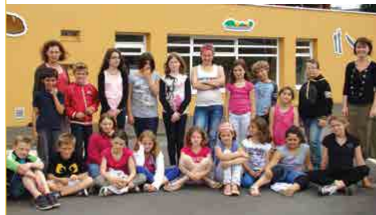
La classe de CM1-CM2 de l'école des Mézières