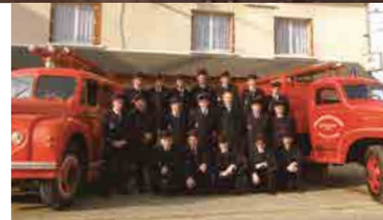
Fin des années 70

« Nos grands-pères restaient une vingtaine d'années en service. Aujourd'hui, on est pompier pendant sept ans en moyenne, rarement plus. Les jeunes quittent plus facilement leur région pour des raisons familiales ou professionnelles. Le turn-over est important. »