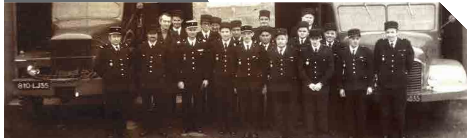
Inauguration de la caserne en 1974

Les années passent et les habitudes changent. Les sapeurs-pompiers de Betton, actifs et retraités, témoignent de l'évolution des usages et des pratiques professionnelles.