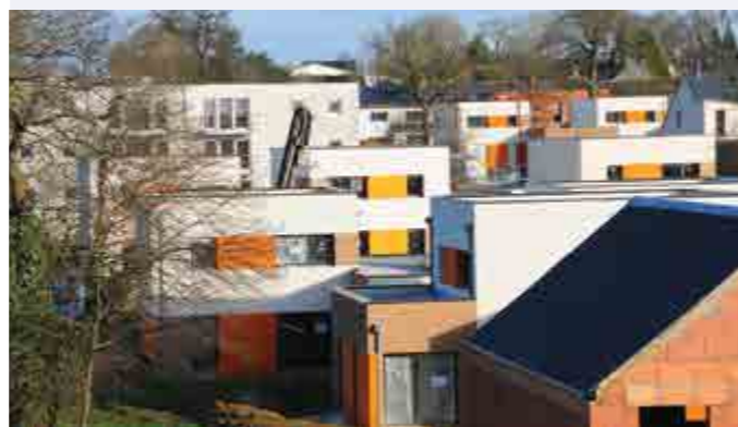
En proposant une diversité de logements, Betton accueille une réelle mixité sociale.

L'Observatoire des inégalités ( www.inegalites.fr ), le compas, bureau d'étude spécialiste des données sociales, et la Gazette des communes ont établi un comparateur des villes en matière d'inégalités et de revenus. Ce classement permet de croiser niveau de vie et inégalités. Elle positionne Betton parmi les 20 premières communes les plus égalitaires. L'indicateur utilisé est l'indice de Gini qui compare la distribution des revenus dans le territoire à une distribution égale. Plus il est proche de zéro, plus on est proche de l'égalité. Plus il est proche de 1, plus les revenus sont inégaux. À Betton, il est de 0,28 ce qui révèle une forte présence des classes moyennes avec un revenu médian de 1 951 €. Ainsi, tout en menant une action volontariste pour accueillir une large population (579 logements sociaux livrés au 1 er janvier 2012 soit 13,5 % des logements sur la commune), notre commune bénéficie d'une réelle cohésion sociale.