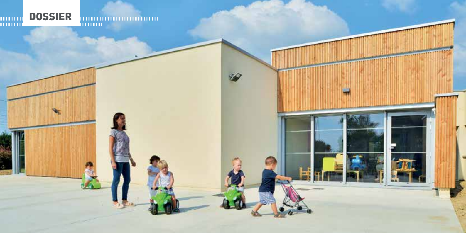
La Ville de Betton a investi dans l'extension du multi-accueil Polichinelle.

« Certaines assistantes maternelles m'informent de disponibilités ponctuelles ou à venir, ce qui me permet de les mettre en relation avec les parents. Nous organisons également des ateliers d'éveil, quatre matinées par semaine. Les parents et les assistantes maternelles viennent, sur inscription, avec les enfants pour ces moments d'échange, de découverte, de socialisation. Ces ateliers d'éveil sont gratuits. » précise Carmen Weber.