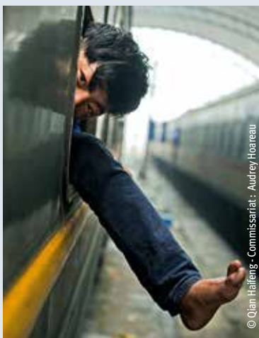
Commissariat : Audrey Hoareau

Le photographe Chinois sillonne son pays depuis plus de dix ans dans les trains bon marché, aux côtés des habitants, des familles et des travailleurs qu'il saisit au vol. À ne pas manquer !