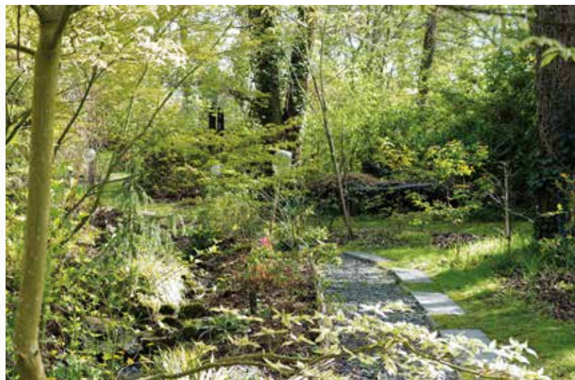
Lieu-dit Les Gobitières.