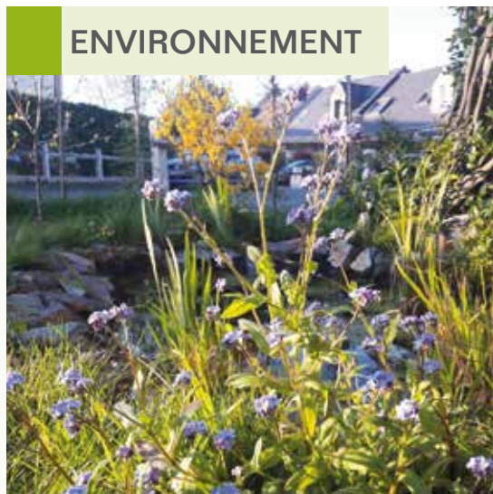
6 rue des Abers.