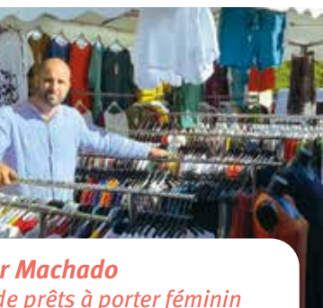
r Machado de prêts à porter féminin

installé depuis 14 ans sur le de Betton et je ne me lasse pas dans lequel je travaille tous s : le canal d'un côté, le u de l'autre. Le tout équipé de enfants et de tables de pique- éal pour accueillir les petits et s. Fruits et légumes mais aussi et autres produits manufactu- rals y sont variés pour satisfaire le que j'ai plaisir à retrouver maine. »