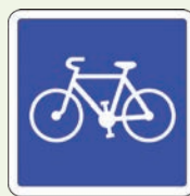
Bande ou piste cyclable conseillée et réservée aux cycles (début et fin).