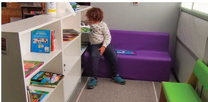
Temps à la bibliothèque