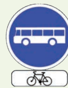
Voie réservée aux véhicules de transport en commun et autorisée aux cycles. En l'absence de panneau, la circulation des cyclistes est interdite dans les voies de bus.