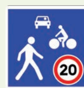
Zone de rencontre : Les piétons ont la priorité et sont autorisés à circuler sur la chaussée. La vitesse est limitée à 20 km/h pour les autres usagers.