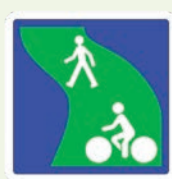
Signalisation d'une voie verte : réservée aux piétons, aux cavaliers et aux véhicules non motorisés (début et fin).