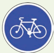
Piste ou bande obligatoire pour les cycles (début et fin).