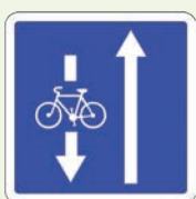
Double sens cyclable : Voie à double sens pour les cycles et à sens unique pour les autres véhicules.