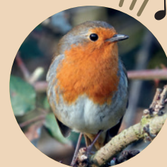
Rouge-gorge Niche au sol début mars.