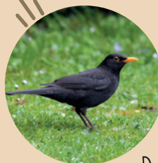
Merle noir Couve déjà dans les haies.