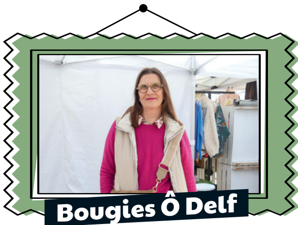
Bougies Ô Delf