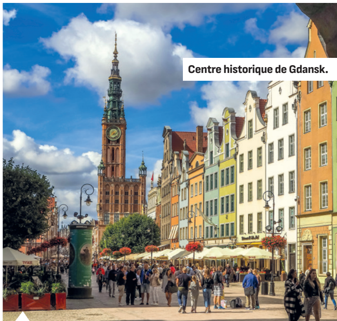
Centre historique de Gdansk.